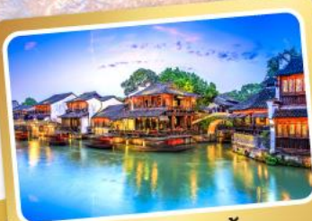
เมืองโบราณอู๋จิ้น