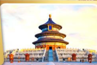
หอฟ้าเทียนฐาน